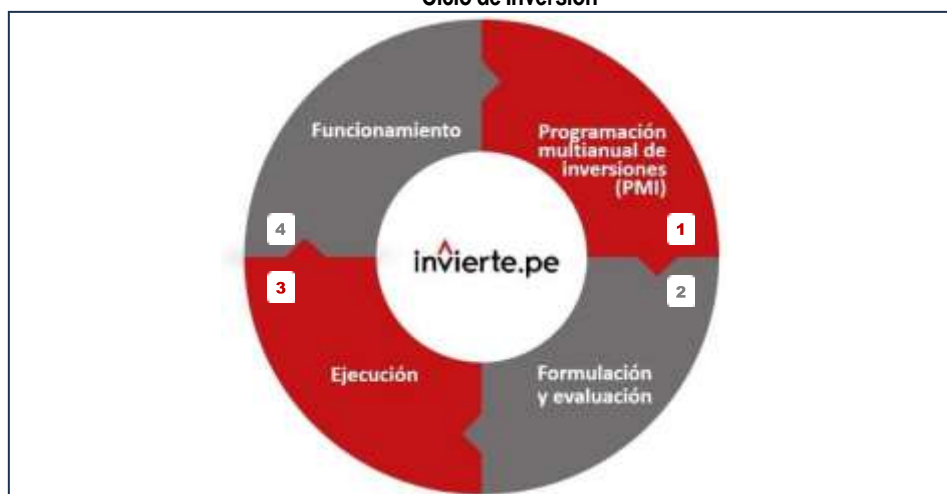
Gráfico n.º 1 Ciclo de Inversión