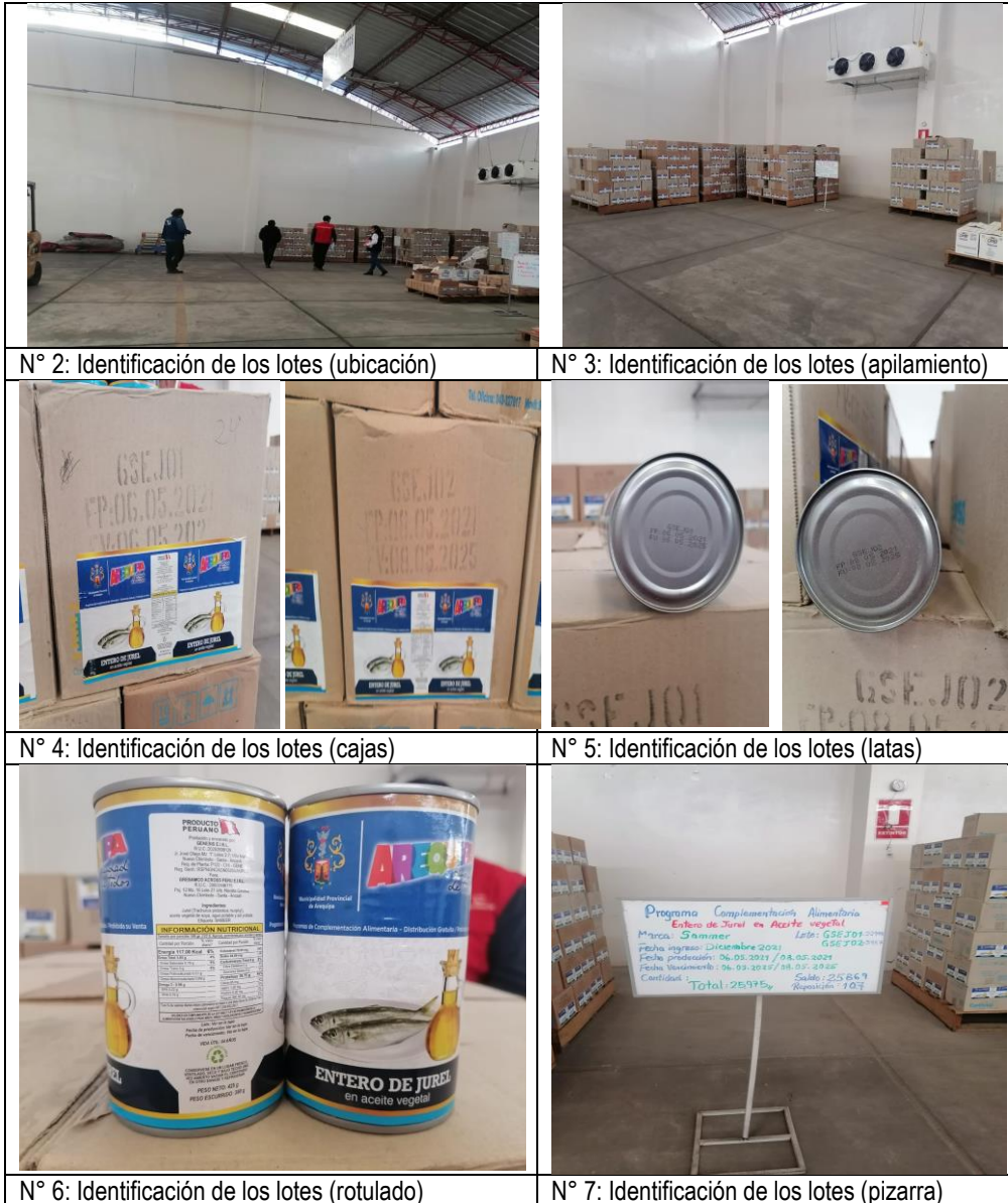
N° 2: Identificación de los lotes (ubicación)